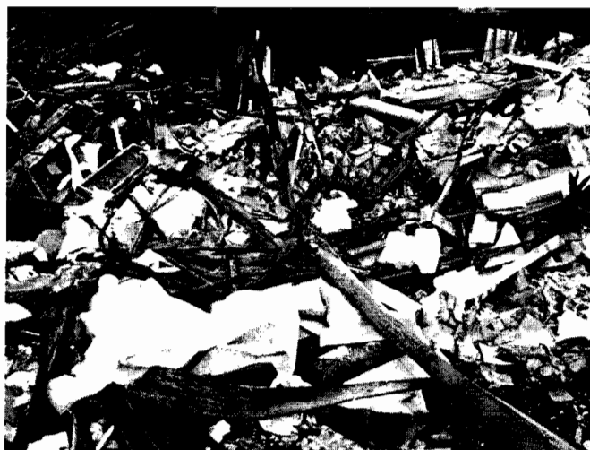
Material residual mezclado