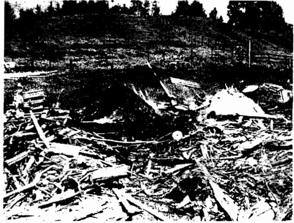
Plaza de carbón vegetal en combustión y arreglo de madera para cubrir luego con tierra e iniciar combustión.

Vehículo con RCD en espera de autorización para ingresar al vertedero.