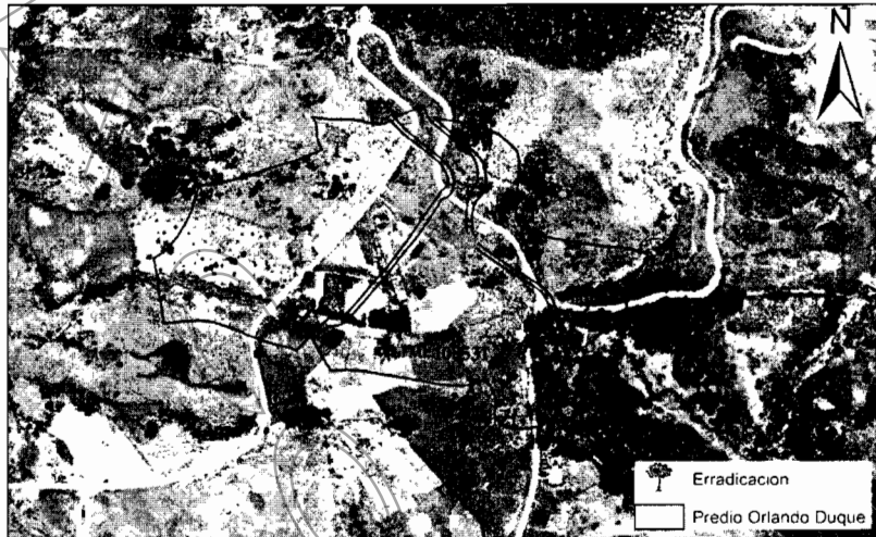
Imagen 1. Coberturas vegetales aledañas a los puntos de intervención, además de los predios que las contienen.

3.2 Por lo visto en visitas anteriores, en el territorio de interés existe una fuerte presión del entorno socioeconómico sobre los remanentes de vegetación natural, generando casi la desaparición de las coberturas boscosas que luego fueron remplazadas por cubiertas antrópicas como; pasturas para crianza de ganado, frijol, aguacate y cultivo de flores. Luego, en estas zonas no existen ecosistemas estratégicos que pueden afectarse por la mencionada actividad, además, la tala no presenta restricciones ambientales según los Acuerdos Corporativos vigentes. No obstante el usuario no podrá intervenir especies más allá de las autorizadas en el presente informe