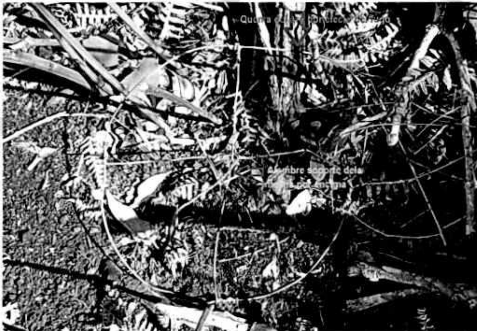
Foto tomada el 8 de agosto durante la visita de práctica d pruebas del aro del globo que supuestamente genero incendio en el predio del municipio de El Peñol en la vereda El Salto.

Gestión Ambiental, social, participativa y transparente