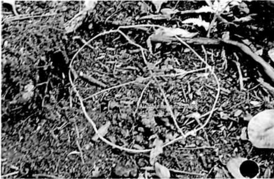
Foto enviada como prueba del aro del globo que supuestamente genero incendio en el predio del municipio de El Peñol en la vereda El Salto.

se evidencia en la curvatura que presenta uno de los alambres donde se amarra la mecha del globo ya que esta queda al lado contrario del que se presenta en la primera foto.