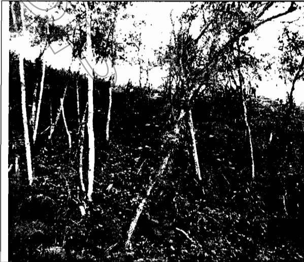
Foto No.1. Zona del bosque donde se realizó la rocería y tala de algunos árboles nativos. En el lugar se realizó la siembra de tomate de árbol, ampliando la frontera agrícola.