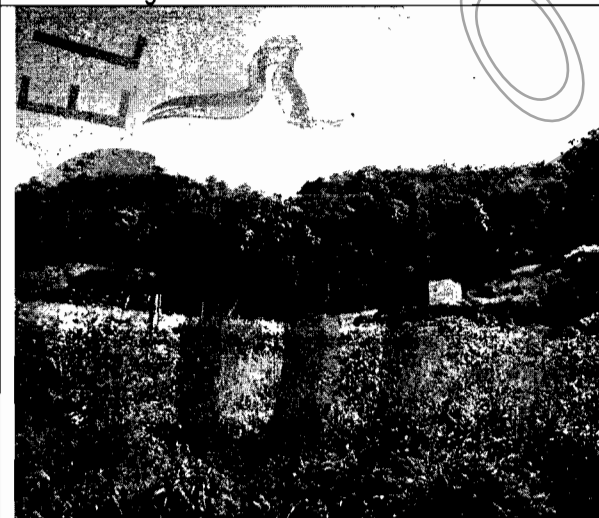
Foto No.1. Se observa la zona donde se estableció el cultivo de tomate de árbol.