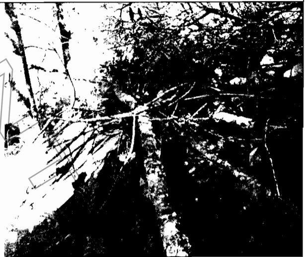
Foto No.2. Se observa la madera y residuos vegetales de la zona intervenida.

Verificación de Requerimientos o Compromisos: Listar en el cuadro actividades PMA, Plan Monitoreo, Inversiones PMA, Inversiones de Ley, Actividades pactadas en planes, cronogramas de cumplimiento, permisos, concesiones o autorizaciones otorgados, visitas o actos administrativos de atención de quejas o de control y seguimiento. Indicar también cada uno de los actos administrativos o documentos a los que obedece el requerimiento.