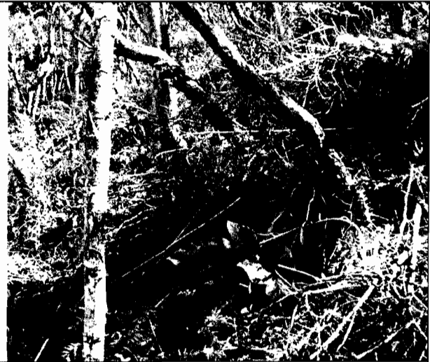
Foto No.2. Se observa un árbol de tomate de árbol sembrado en la base de unos árboles de sietecueros.