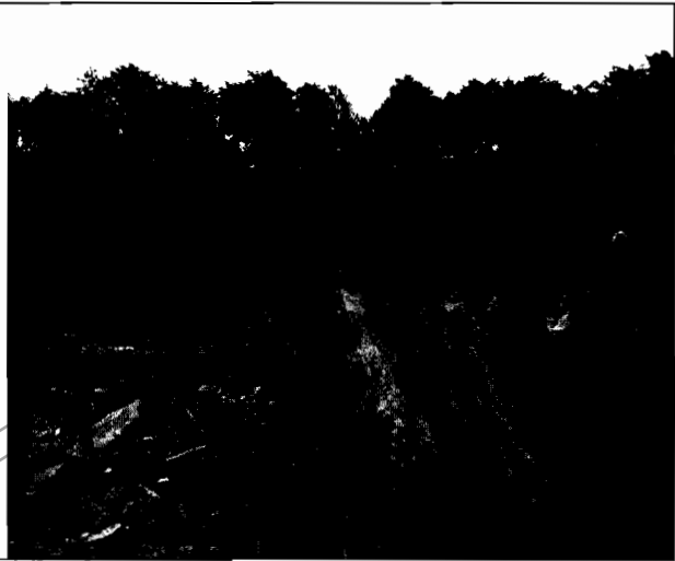
Foto No.2. Se observa la volqueta depositando los residuos vegetales de poda en el predio del señor Solano.