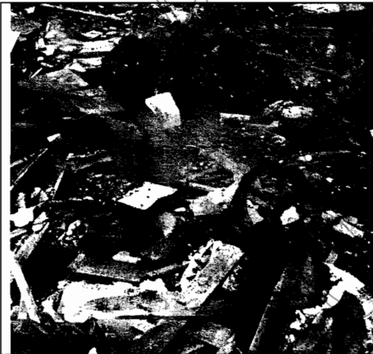
Foto No.5. Incendio subterráneo que se presenta en el lugar donde se depositan los residuos.