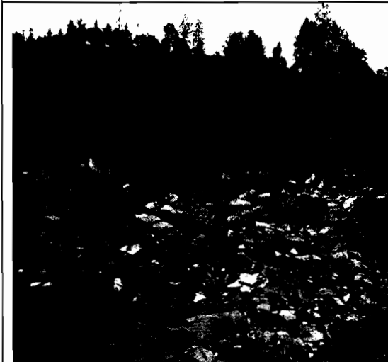
Foto No.3. Diferentes clases de residuos que vienen siendo dispuestos en el predio.