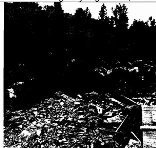
Foto No. 7. Se observa una pila donde se procesa carbón vegetal.