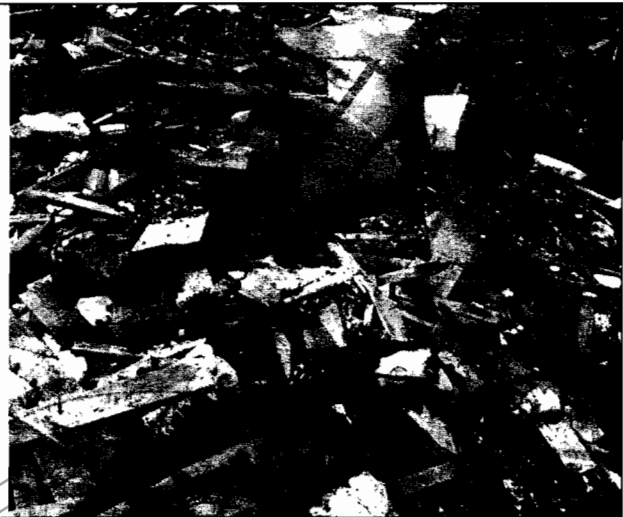
Foto No.6. Incendio subterráneo que se presenta en el lugar donde se depositan los residuos.