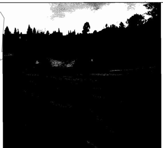
Foto No.4. El predio se encuentra cercado con tela perimetral y al interior se encuentra demarcado con cintas los lotes y vías.