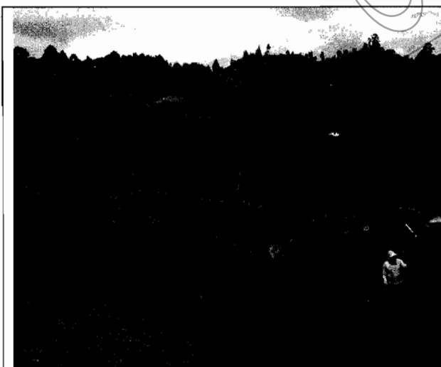
Foto No.3. Movimientos de tierra que se vienen llevando a cabo en el predio.