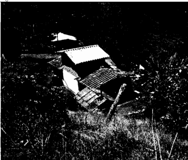
Foto No.1. Se muestra el predio antes de la tala.

número de árboles talados. El interesado aportó unas fotos de antes y después de la tala de los árboles.