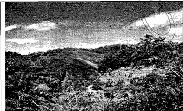
Foto No.1. Se observan los cultivos de hortensia bajo polisombra.