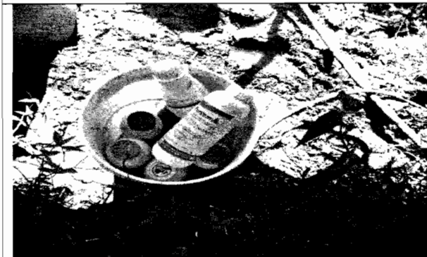
Foto No.3. Envases de agroquímicos de los productos utilizados en el cultivo. Se observa de banda roja o extremadamente tóxico