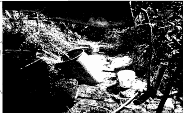
Foto No.2. La preparación de los agroquímicos se realiza a un lado de la fuente hídrica. Se observa empaques de agroquímicos dispuestos a lado de la fuente.