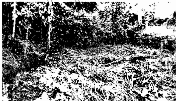
Vegetación protectora eliminada de las márgenes de la fuente hídrica sin nombre.