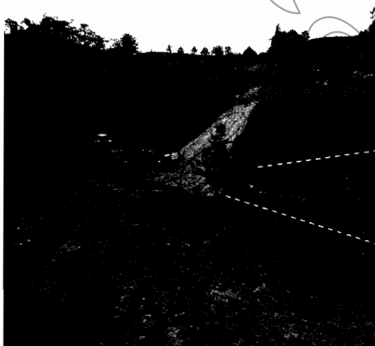
Figura 2. Visita del 3 de mayo

En la visita realizada el 18 de mayo se evidenció que se había delimitado la ronda y se había implementado un tríncho como obra de retención de sedimentos, sin embargo, se observó que persiste la afectación de la fuente hídrica con sedimentos producto de las adecuaciones realizadas (ver figura 3).