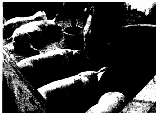
Fotografía No. 5 Corrales parte baja