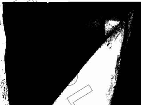
Fotografía No. 2 Corral parte alta