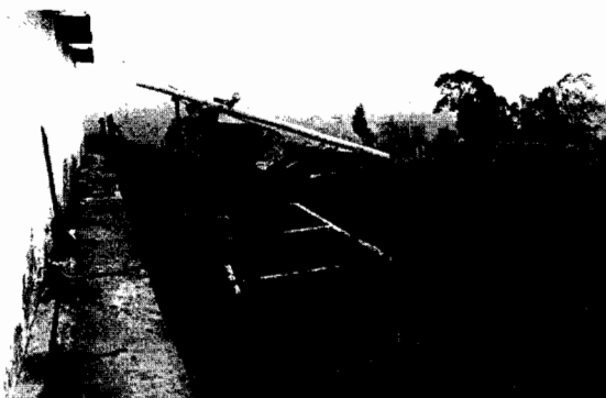
Fotografía No. 1 Tanque estercolero parte alta