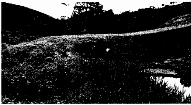
Figura 1. Cobertura vegetal en el talud aguas arriba de la quebrada y material triturado en la parte superior