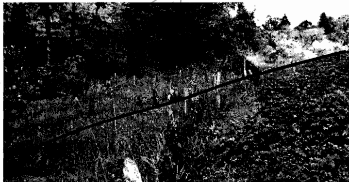
Figura 3. Cultivo en la ronda hídrica de protección