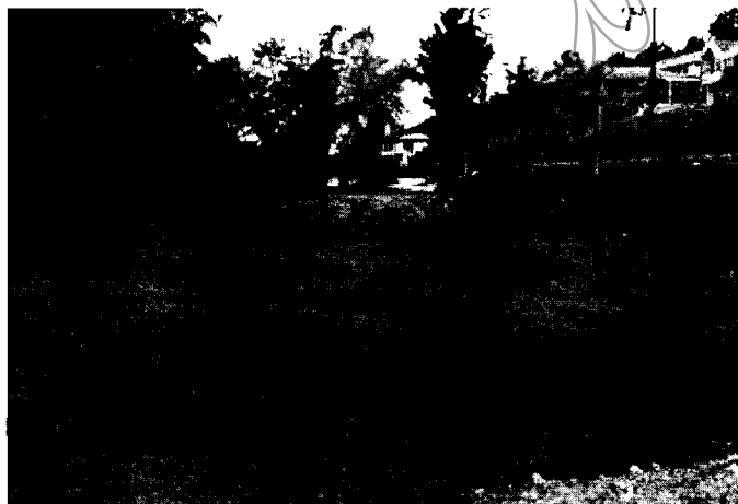
Figura 1. Lleno sobre la margen derecha de la quebrada La Marinilla