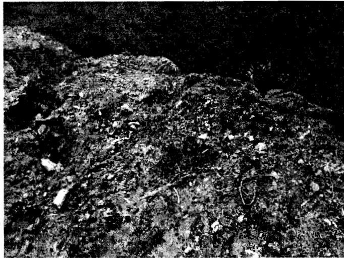
Figura 2. Materiales del lleno