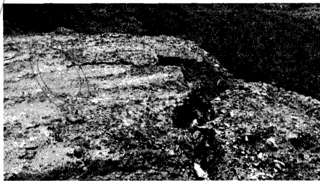
Figura 3. Procesos erosivos (cárcavas)