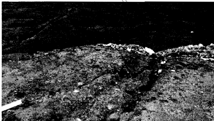
Figura 4. Procesos erosivos (cárcavas)