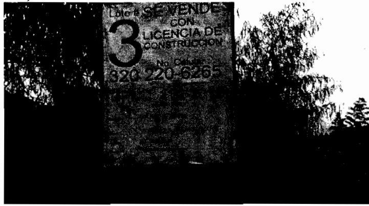
Figura 2. Letrero con información de la licencia de construcción