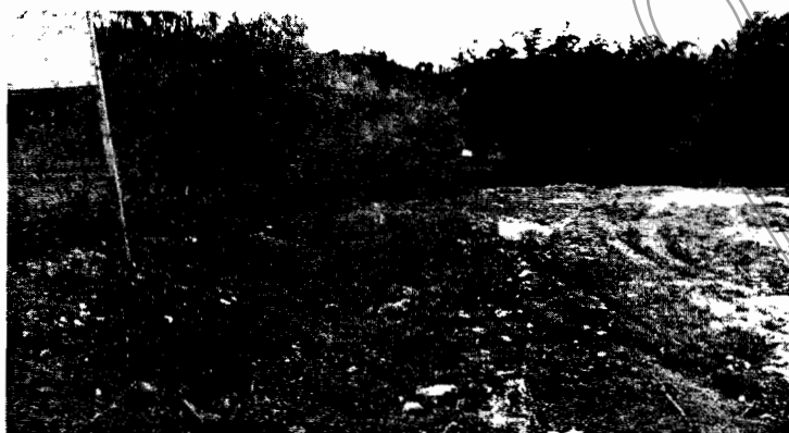
Figura 1. Lleno sobre la margen derecha de la quebrada La Marinilla