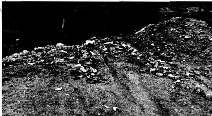
Figura 3. Materiales del lleno