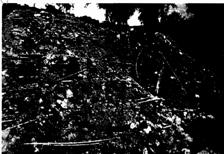
Figura 3. Materiales del lleno