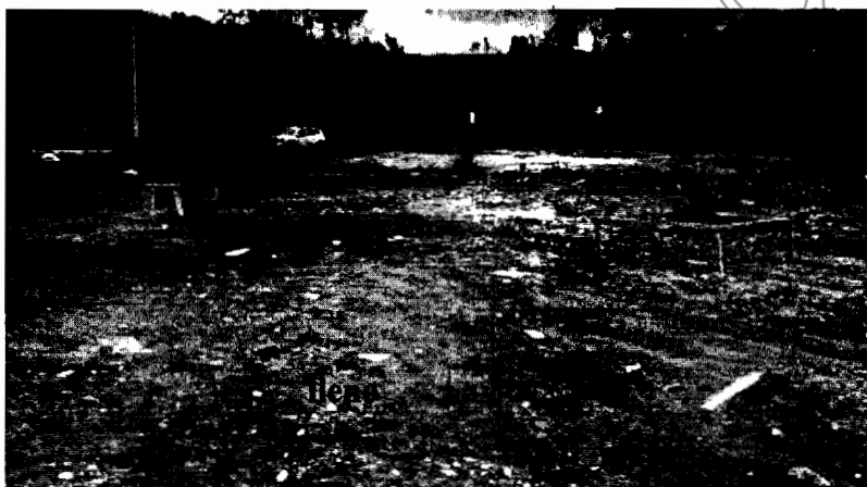
Figura 1. Lleno sobre la margen derecha de la quebrada La Marinilla

Ruta: www.cornare.gov.co/sai / Apoyo Gestión Jurídica y Anexos