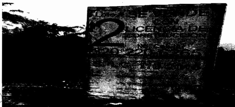
Figura 2. Letrero con información de la licencia de construcción