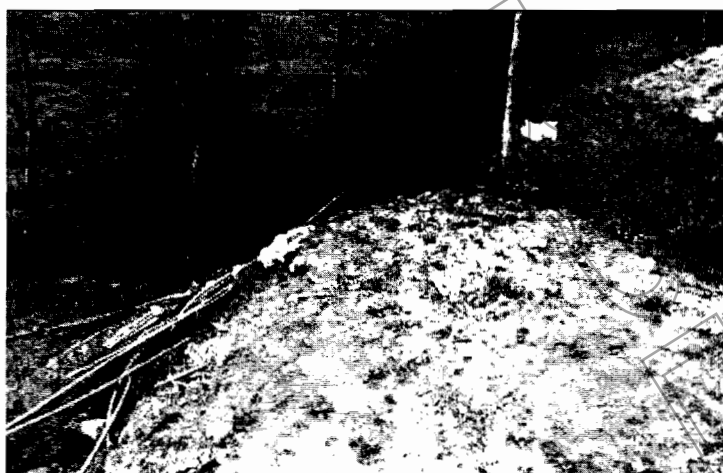
Figura 4. Procesos erosivos (surcos)