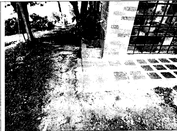
Daños restaurados de la vivienda