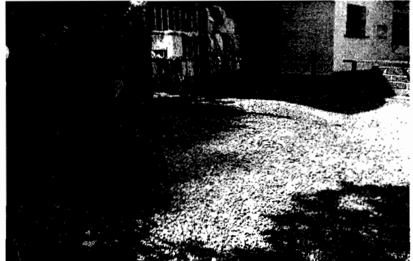
Fotografía No. 2 Vivienda de la Señora Ríos