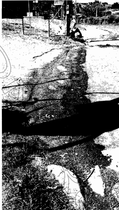
Fotografía No. 3 Vertimiento de aguas grises a la vía