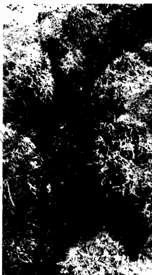
Ilustración 2- Fuente hídrica