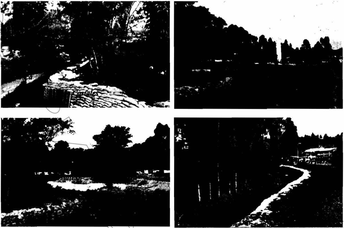
Ilustración 1- Situación presentada