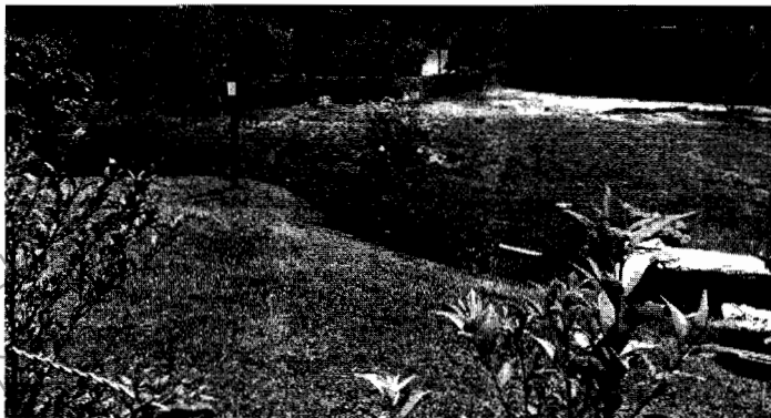
Estado actual del predio donde se desvió el canal de la Quebrada la Gurupera