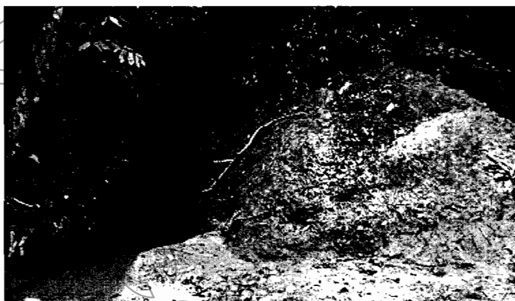
Material depositado cerca al canal natural de la fuente hídrica sin nombre