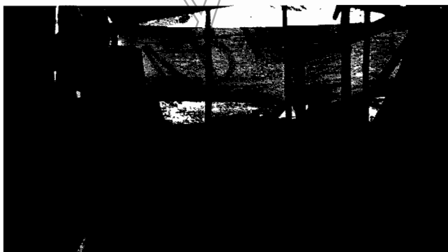
Fotografía No. 20 Cerramiento

CUMPLIDO PARCIALMENTE: se evidencia material en el piso