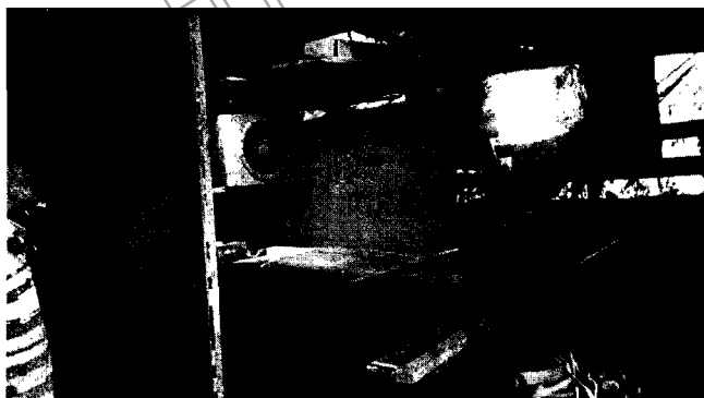
Fotografía No. 29 Extractor en zona de pintura

NO CUMPLIDO: se evidencia un establecimiento con gran cantidad de residuos en el piso