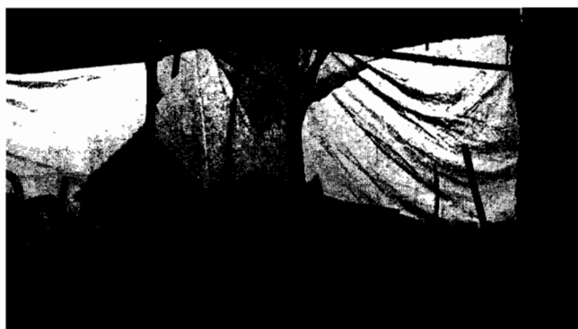
Refuerzo del cerramiento