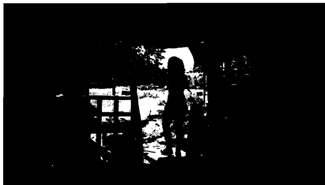
Fotografía No. 30 Cerramiento inadecuado