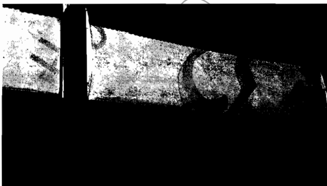
Fotografía No. 26 Cerramiento incompleto

NO CUMPLIDO: Aún no se entregan este tipo de residuos a una empresa autorizada, normalmente se entregan a la ruta ordinaria