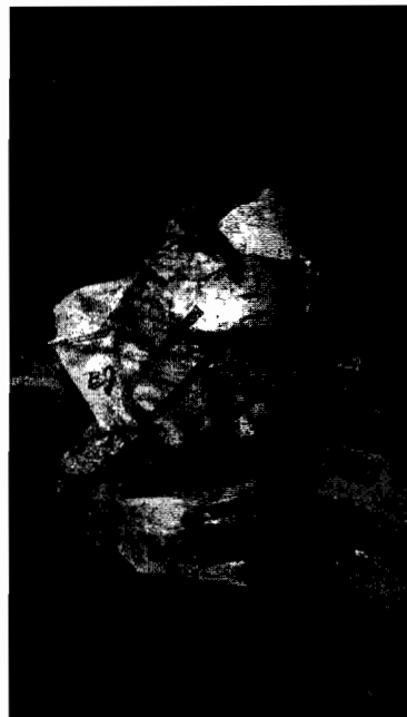
Almacenamiento actual de residuos peligrosos RESPEL