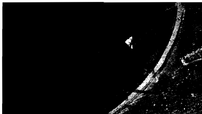
Fotografía No. 27 Extractor en zona de pintura