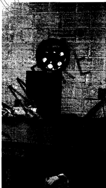
Extractor zona de pulido

NO CUMPLIDO: Aún no se entregan este tipo de residuos a una empresa autorizada, normalmente se entregan a la ruta ordinaria