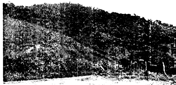
Bosque secundario ubicado en las partes altas de la Finca "La Colombia" aledaños a los sectores donde se realizará la plantación con cítricos.

Las plantaciones establecidas en los predios de la Finca La Colombia, presentan buen manejo para su normal desarrollo, no se observan alteraciones en su comportamiento.