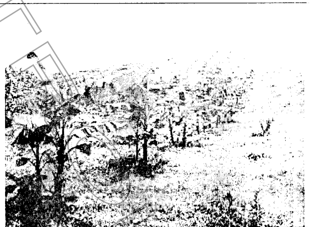
Plantación mixta con plátano y mandarina en un sector de la finca "La Colombia" W: 75° 13' 12,3" N: 06° 32' 30,6" Z: 1196 msnm