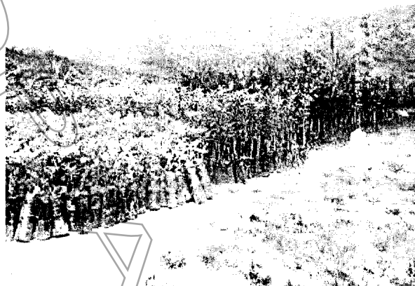
Material vegetal (guayabo, limón, mandarina) ubicado en la Finca "La Colombia" para siembra en mayo de 2015 en otros sectores. Coordenadas: W: 75°13'12,3" N: 06°32' 30,6" Z: 1196 msnm