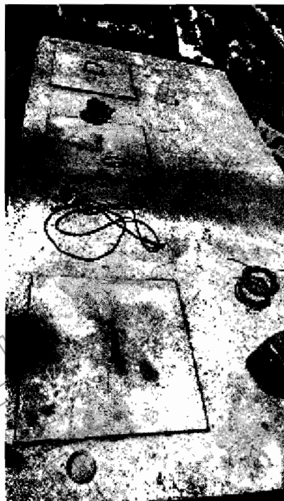
Imagen 2. Pozo Séptico que recibirá las aguas residuales de la propiedad del señor Albeiro Montoya.