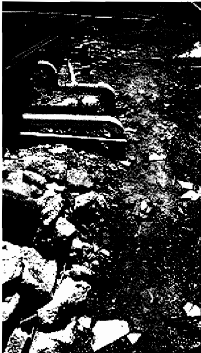
Imagen 1. Tuberías que conducirán aguas residuales hasta el pozo séptico.