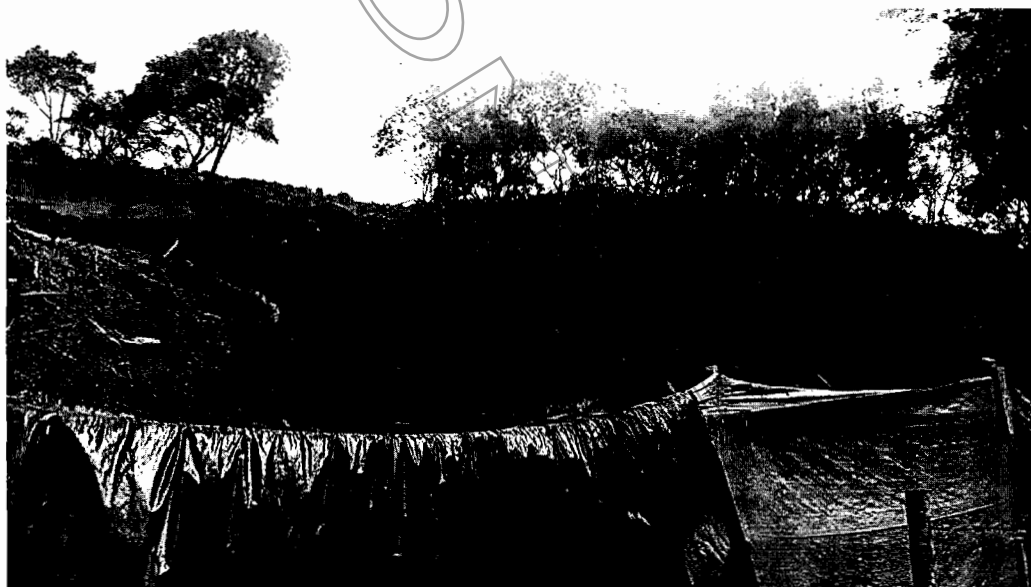
Fotografía 1, lugar del aprovechamiento