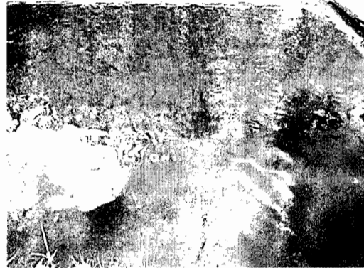
Imagen 1- 2 Mortandad de peces