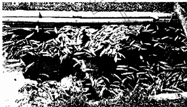
Imagen 4 Mortandad de peces