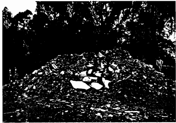
Depósito de residuos y escombros sobre la margen izquierda del río Negro