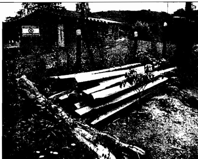
Foto No.2. Madera arrumada en el predio del señor FRANCISCO OROZCO.