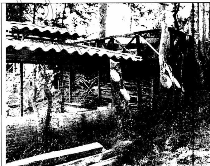
Foto No.1. Se muestra el DEC construido en el predio del señor FERNEY CORTES, en todo en el lindero con el predio del señor FRANCISCO OROZCO. Debajo del DEC se evidencian residuos vegetales. También se observan los tocones de los árboles que fueron talados en el lindero.