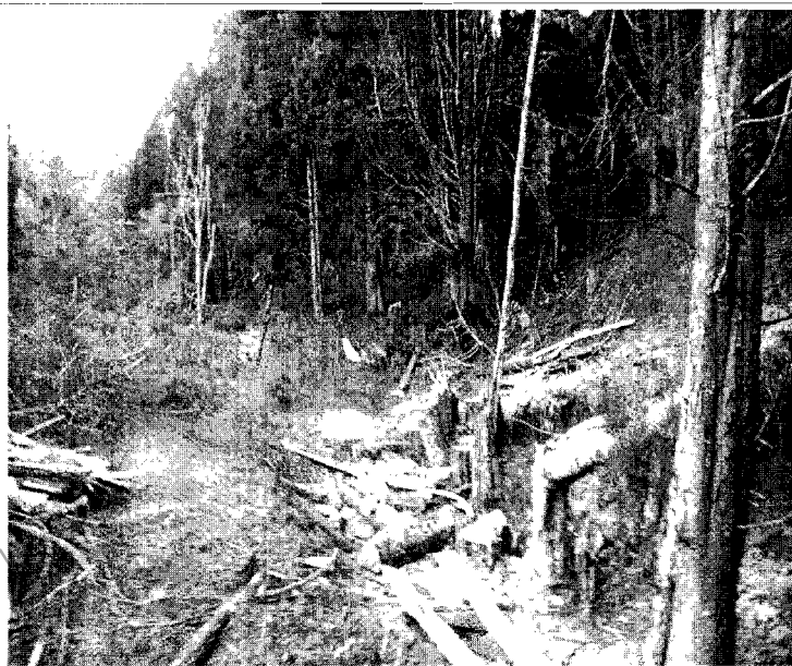
Zonas de aprovechamiento forestal