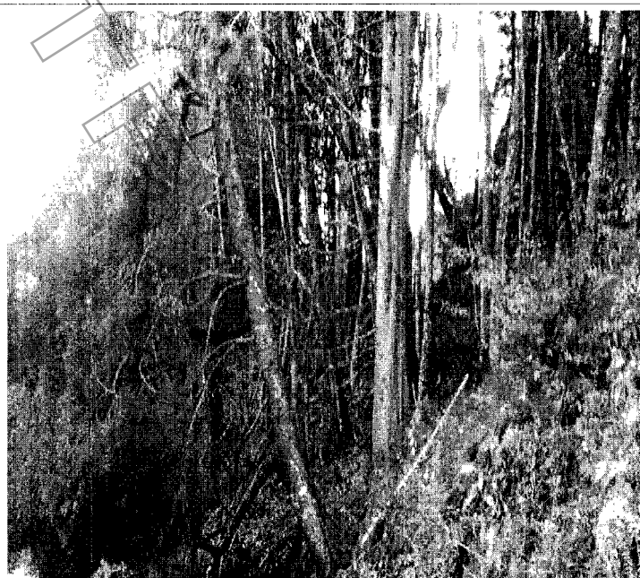
Parte alta del predio, sendero peatonal, especies en pie dentro del predio.