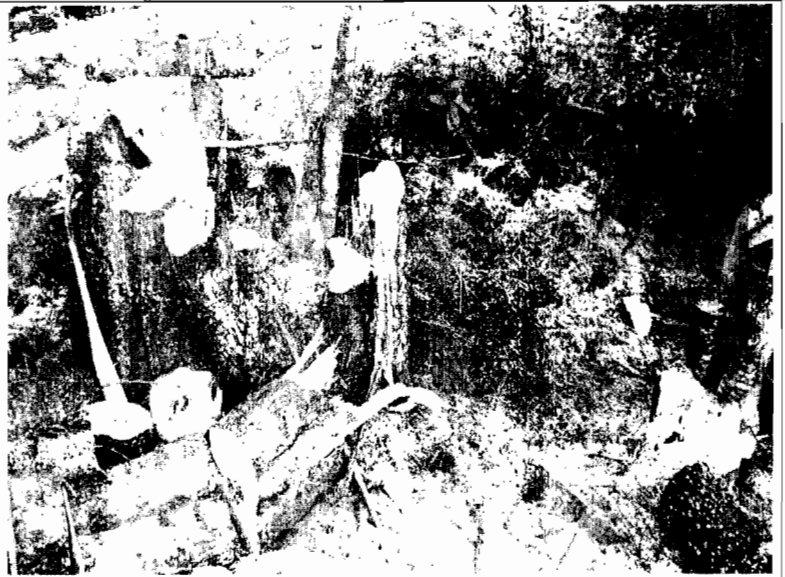
Tocones de las especies apeadas.