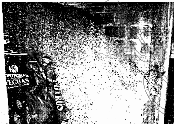
Ilustración 2- Viruta