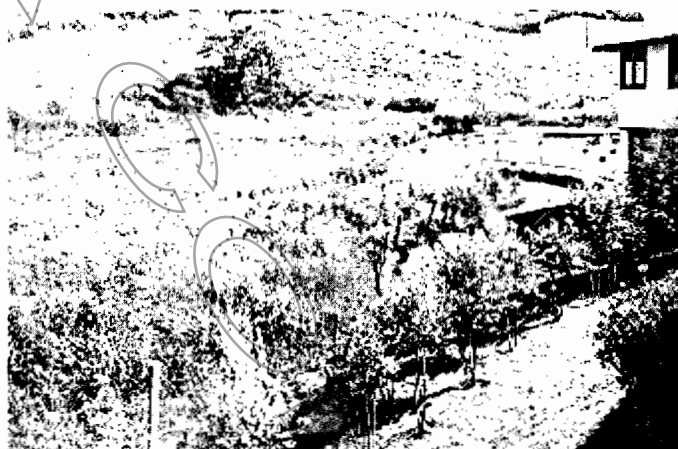
Ilustración 1- Fuente hídrica sin presencia de viruta