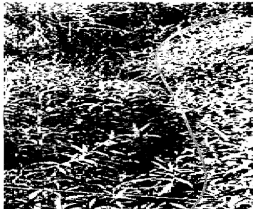
Ilustración 36- Aguas abajo