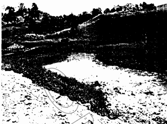
Ilustración 3- Foto tomada en junio de 2015