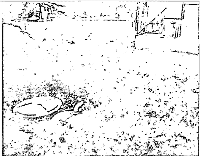
Foto No.2. Se observa el sistema de tratamiento construido para la perrera.

Verificación de Requerimientos o Compromisos: Listar en el cuadro actividades PMA, Plan Monitoreo, Inversiones PMA, Inversiones de Ley, Actividades pactadas en planes, cronogramas de cumplimiento, permisos, concesiones o autorizaciones otorgados, visitas o actos administrativos de atención de quejas o de control y seguimiento. Indicar también cada uno de los actos administrativos o documentos a los que obedece el requerimiento.