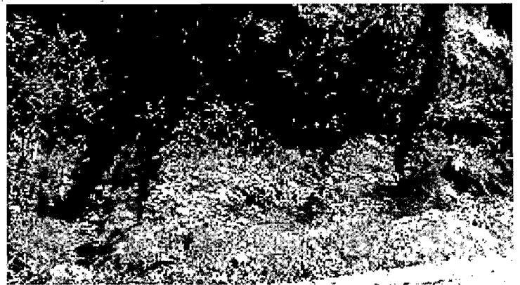
Imagen 2. Fuente hídrica que discurre por el sector.