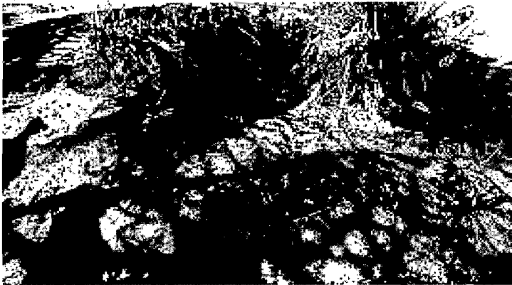
Imagen 1. Ubicación del sistema de tratamiento de aguas residuales en vivienda de futbolistas.