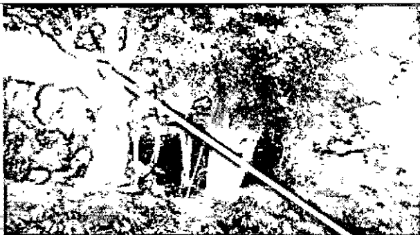
Árbol Aguacatillo ( Persea sp ) para podar, eliminar rama y realizar limpieza, ubicado en el antejardín de la vivienda con dirección Calle 21A No. 46-59 del Barrio Ciudadela Artesanal del Municipio de Marinilla