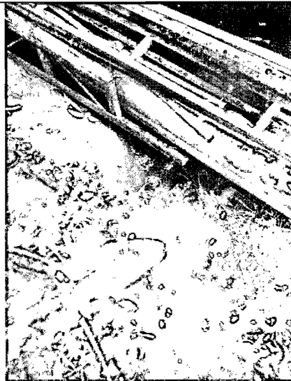
Fotografía No. 2 Sistema para conducir aguas al sedimentador y trampas de grasas

Verificación de Requerimientos o Compromisos: Listar en el cuadro actividades PMA, Plan Monitoreo, Inversiones PMA, Inversiones de Ley, Actividades pactadas en planes, cronogramas de cumplimiento, permisos, concesiones o autorizaciones otorgados, visitas o actos administrativos de atención de quejas o de control y seguimiento. Indicar también cada uno de los actos administrativos o documentos a los que obedece el requerimiento.