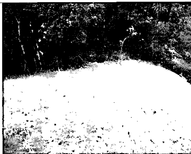
Foto No.2. Sobre la vertiente no se evidencia arrastre de sedimentos. El predio presenta buena cobertura vegetal nativa en proceso de sucesión.

Verificación de Requerimientos o Compromisos: Listar en el cuadro actividades PMA, Plan Monitoreo, Inversiones PMA, Inversiones de Ley, Actividades pactadas en planes, cronogramas de cumplimiento, permisos, concesiones o autorizaciones otorgados, visitas o actos administrativos de atención de quejas o de control y seguimiento. Indicar también cada uno de los actos administrativos o documentos a los que obedece el requerimiento.