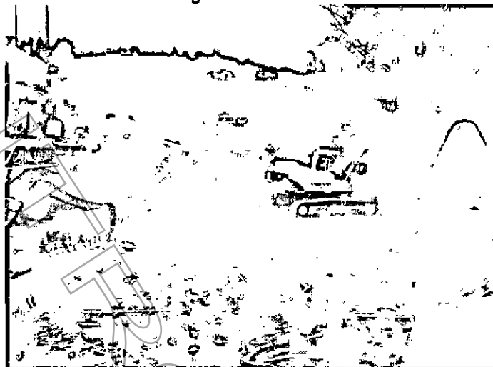
Fotografía No. 4 Maquinaria