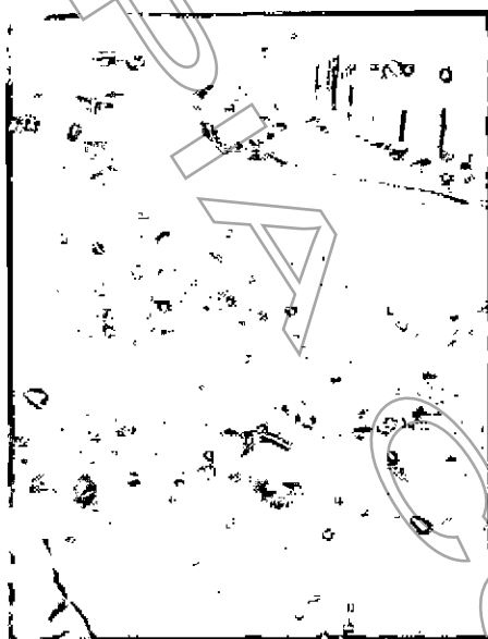
Fotografía No. 1 Intervención del cauce