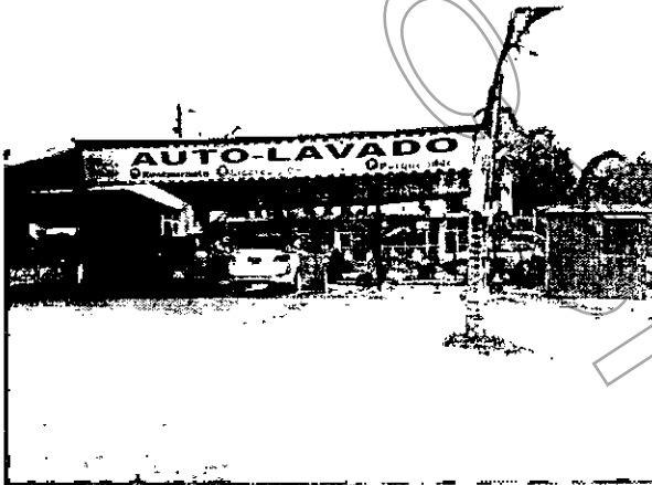
Fotografía No. 1 zona de lavado de vehículos segundo recorrido

Las estopas y trapos usados en el lavado de los vehículos, son depositados junto con los residuos ordinarios y entregados a la empresa RIOASEO TOTAL, en la ruta habitual de aseo.