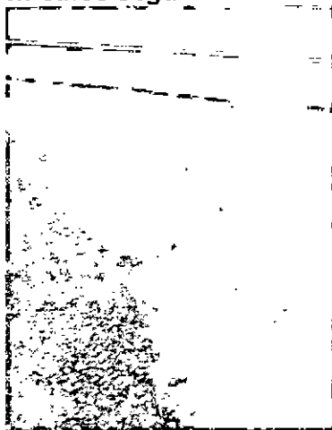
Fotografía No. 3. Vertimiento a la vía