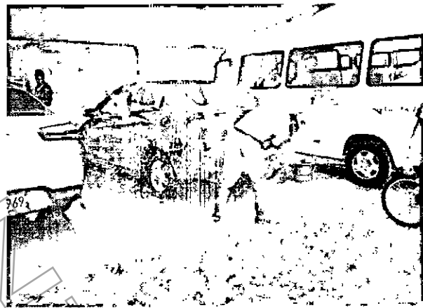
Fotografía No. 2. Lavado de vehículos primer recorrido