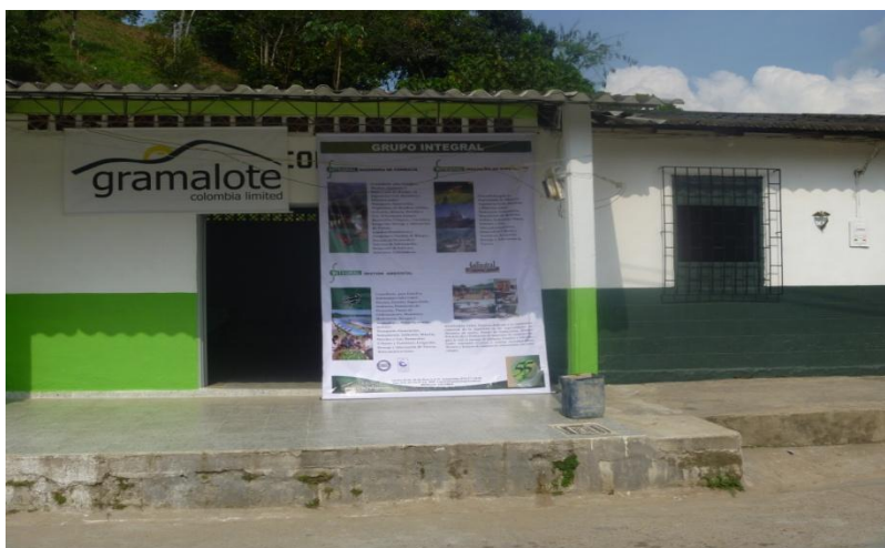
Fotografía 1.2 Punto de información en Providencia.

Este espacio ubicado en el corregimiento de providencia, se creó como punto para brindar información amplia y veraz acerca del Proyecto y de la actividad censal.