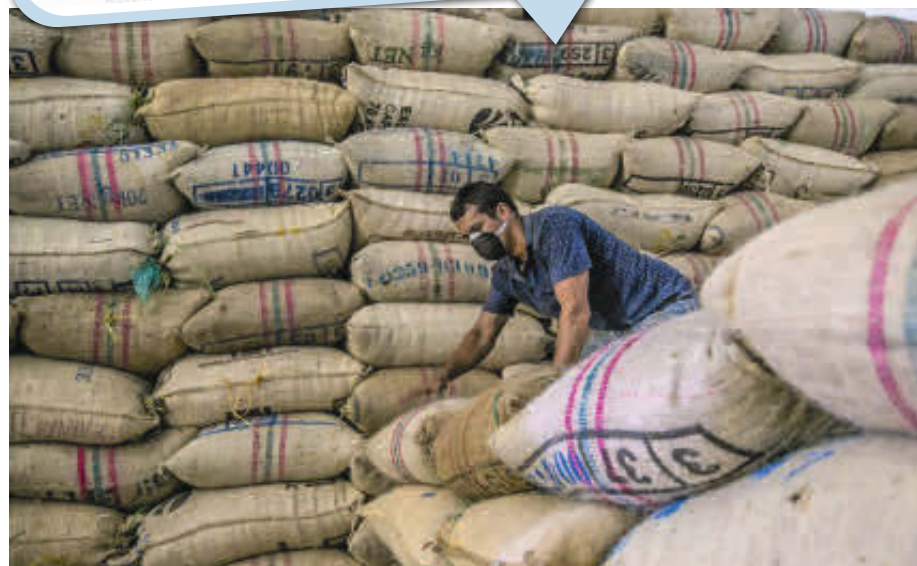
Fedecafé realizará también la reacomodación de cargos administrativos, que en adelante funcionarán para toda la Federación.