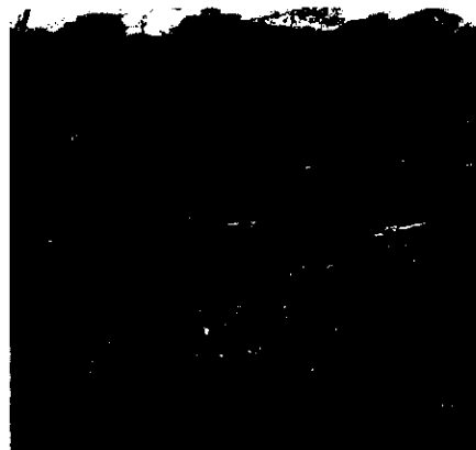
Zona de recarga Hídrica con cultivos de plátano

La siembra de café se piensa realizar en una zona de recarga hídrica donde también se sembraron matas de plátano, lo que implicaría posible contaminación a la fuente de donde se abastece la Escuela de la vereda La Linda, la zona de nacimiento se encuentra con un bajo nivel de protección pues su aislamiento natural se ha venido menguando con la limpieza del terreno para la adecuación para cultivos permanentes de café, en la parte baja de la captación se implementaron cultivos de caña de azúcar a menos de 1 metro del discurrir de la fuente.