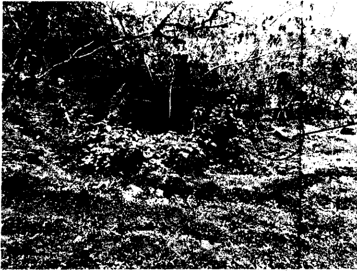
Mata de rascadera cortada