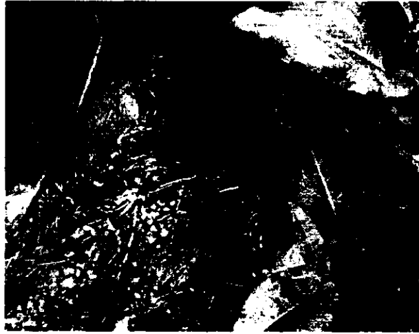
Imagen 1: Vertimiento de aguas residuales domésticas.