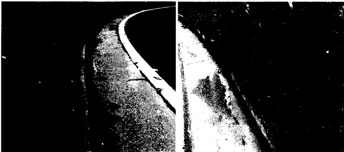
Imagen 3: Berma de la vía con presencia de arenas.

Sobre el cumplimiento de la resolución que otorga el permiso de vertimientos: